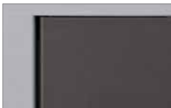
Barnizado en polvo específico para uso externo anti-UV

Partes electrónicas bien protegidas de los agentes externos