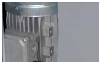
Motores robustos y de altas prestaciones